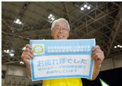
最後の一人が帰るまで、お見送りをさせていただきました。