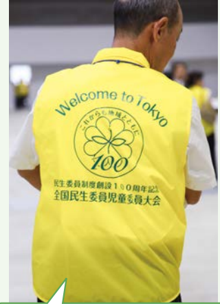
Welcome to Tokyoと書かれたベストで迎えました。